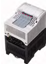
Modul de Iesiri Digitale cu Valve, seria 9478

Cerintele de spatiu minimale si costurile pe canal reduse precum si engineering-ul mult simplificat, fac din DOMV o alternativa foarte atractiva in comparatie cu insulele separate de electrovalve in zonele periculoase. Modulul este certificat ATEX si IECEx pentru instalatarea in Zona 1 si are o intrare intrinsec sigura SIL 2 pentru oprirea procesului.